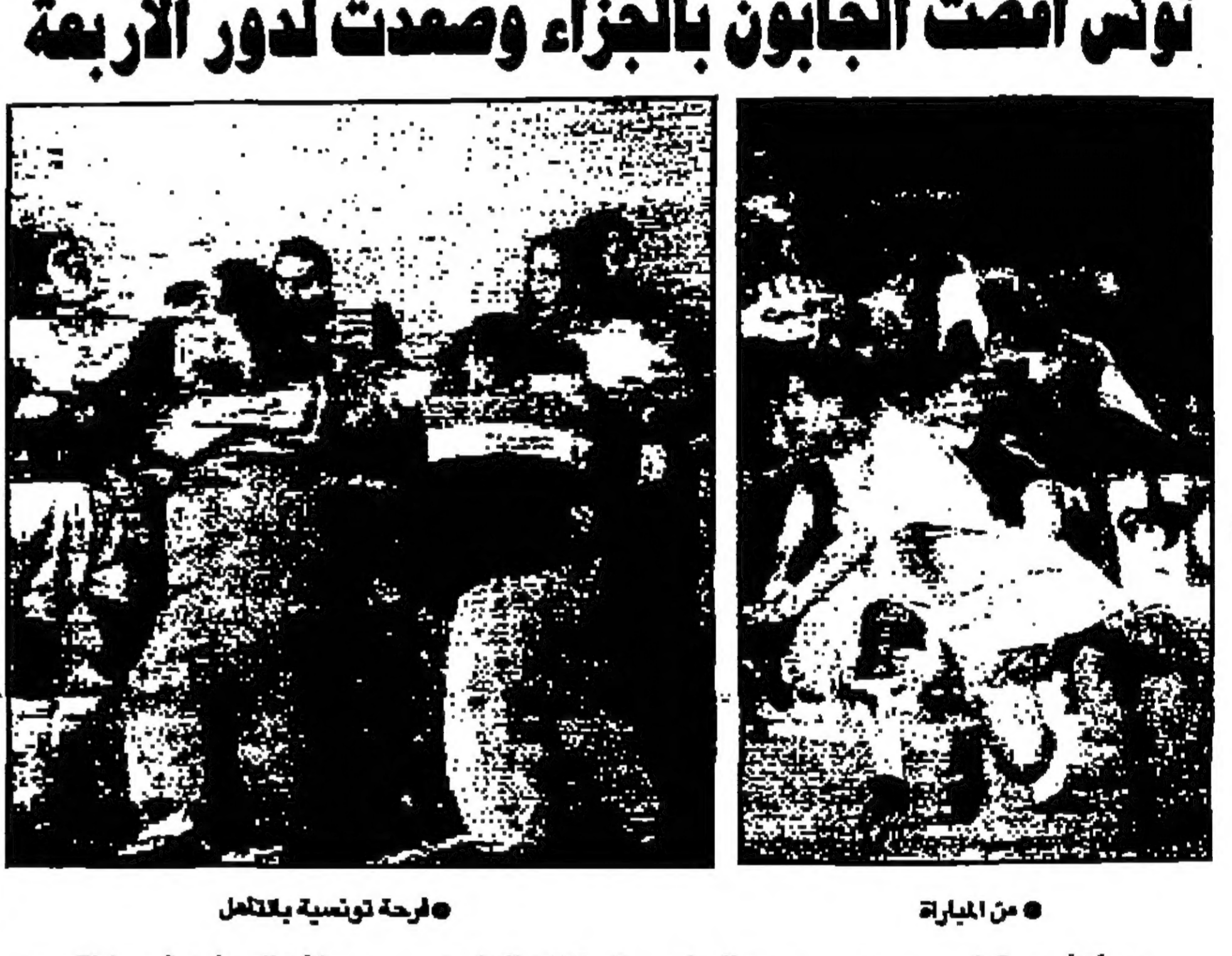
فرحة تونسية بلقائل